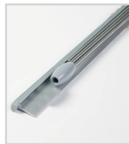
Mât en 2 parties