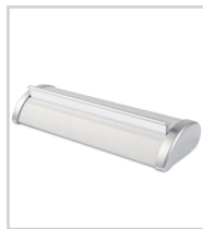
Extrémités de carter anodisées grises